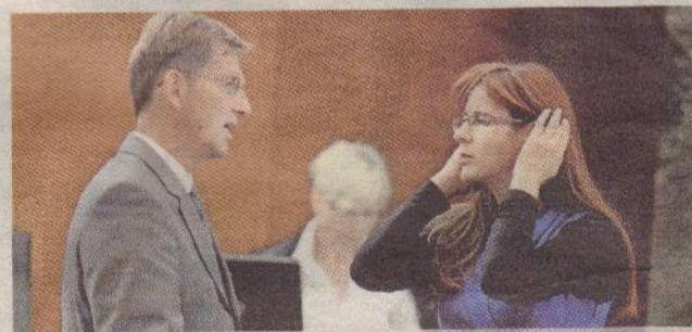
Premier dr. Miro Cerar in obrambna ministrica Andreja Katič: ni dovolj, da si slednja popravila lase in ob tem morda zatiska ušesa.

Dodana doba se zanje upošteva dvakrat, pri poklicni in tudi pri starostni upokojitvi, kar se bo pokazalo v (delovnem) sodnem sporu zoper odločbo o starostni upokojitvi člana SVS. Dodana doba se ne upošteva pri odmeri starostne pokojnine, zaradi njenega (ne) upoštevanja pri ugotavljanju pogojev za starostno upokojitev pa se večina zavarovancev starostno upokojuje s 35 do 36 leti pokojninske dobe ter z nižjo pokojninsko odmero od