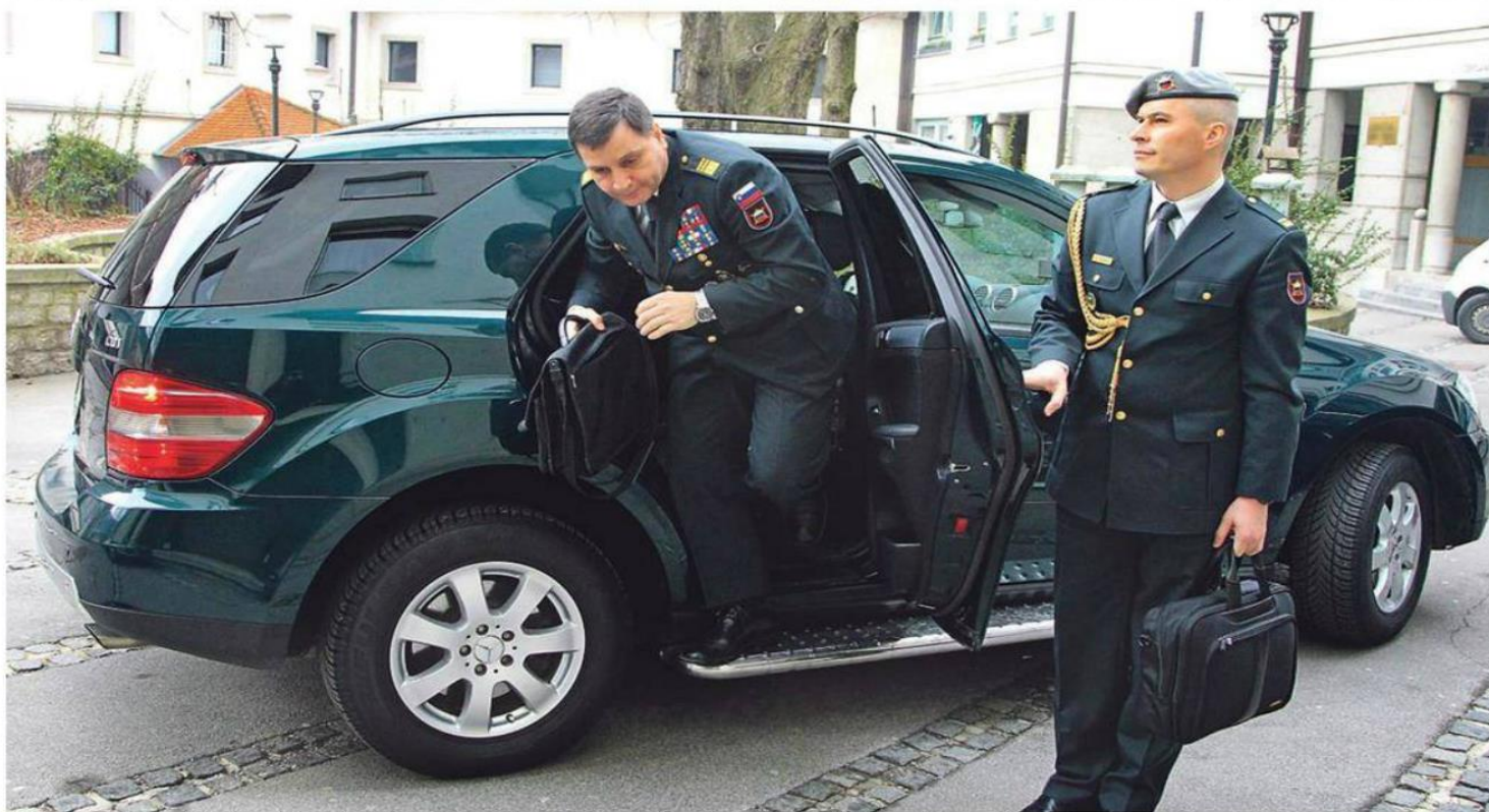
Službeni avto je na voljo le še enajstim pripadnikom SV, na ministrstvu in v upravi za reševanje pa je takšnih upravičencev 25.