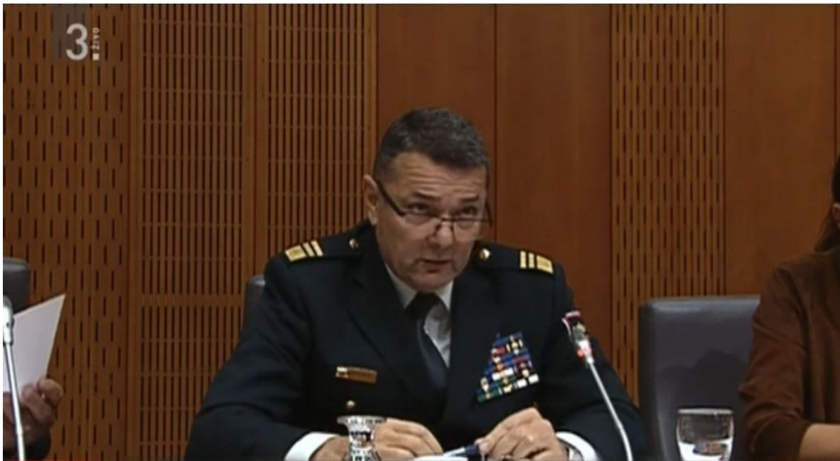
Generalmajor Alan Geder - namestnik načelnika Generalštaba SV